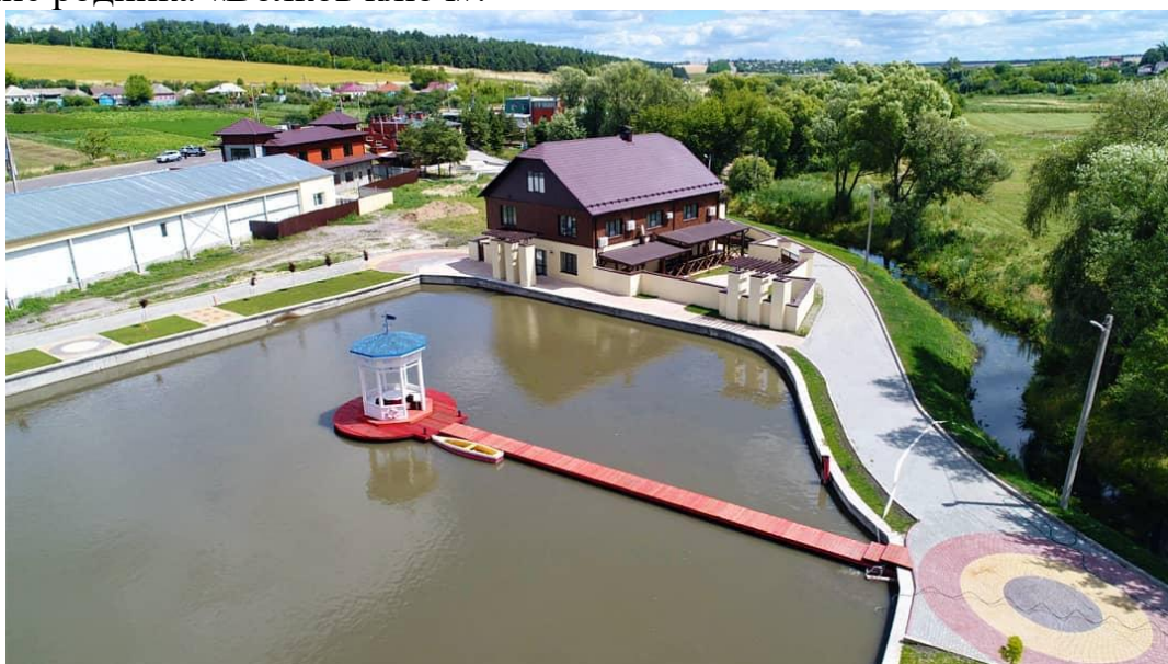
Рис. 7. Село Журавлино: Комплекс «Волков ключ»

Деревня Журавлино. Около села Журавлино в Октябрьском районе Курской области выстроен ландшафтно-сервисный комплекс, основанный на использовании родниковой воды. Родник приобрел известность в XIX веке. Местные жители верили в целительную силу воды и относились к источнику весьма бережно. За чистотой следил крестьянин по фамилии Волков, отсюда и название родника «Волков ключ».