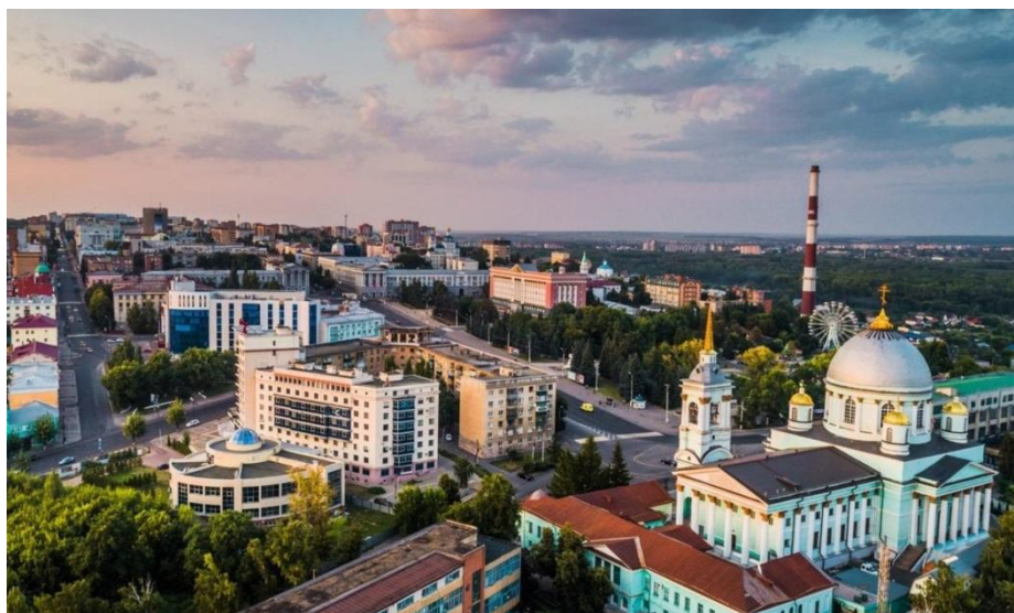
Рис. 1 Город Курск. Вид на водораздельное плато улиц Радищева и Ленина

Город Курск - административный, промышленный и культурный центр Курской области. Динамично развивается сфера сервиса. Действует большое количество учреждений образования, здравоохранения, социальной поддержки, культуры, досуга, физкультуры и спорта.