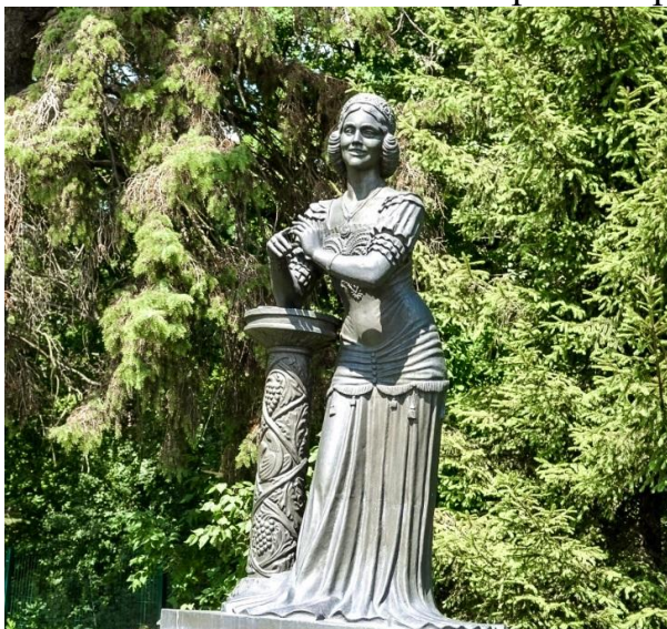
Рис. 6. Памятник Надежде Плевицкой в селе Винниково.

Село Винниково. Недалеко Курска, в верховьях речки Виногробль, расположено село Винниково. Свою известность село получило благодаря уроженке этих мест - Надежде Васильевне Плевицкой (см.рис.6). 3 октября 2009 года, к 130-летию со дня рождения певицы, в селе был торжественно открыт музей Н.В. Плевицкой. Экспозиция, выставленная в музее, посвящена не только биографическим подробностям знаменитой землячки, музей так же знакомит посетителей с историей её родного села Винниково.