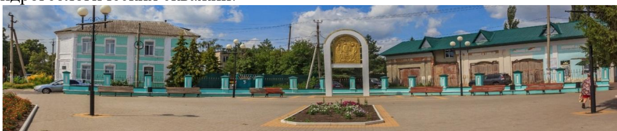
Рис. 4. Город Щигры

Небольшой провинциальный город, но обладает значительным промышленным потенциалом. Например, на центральной площади города есть памятник первооткрывателям Курской Магнитной Аномалии. Здесь, в 1923 году на глубине 167 метров были добыты первые образцы железной руды. Курская Аномалия - самый мощный на Земле железорудный бассейн. И, конечно, завод ГЕОМАШ — российский производитель бурового оборудования. Он производит самоходные и малогабаритные буровые установки для решения задач в области бурения геологоразведочных, сейсморазведочных, инженерно-геологических скважин, бурения скважин различного назначения при выполнении строительных работ, а также гидрогеологических скважин.