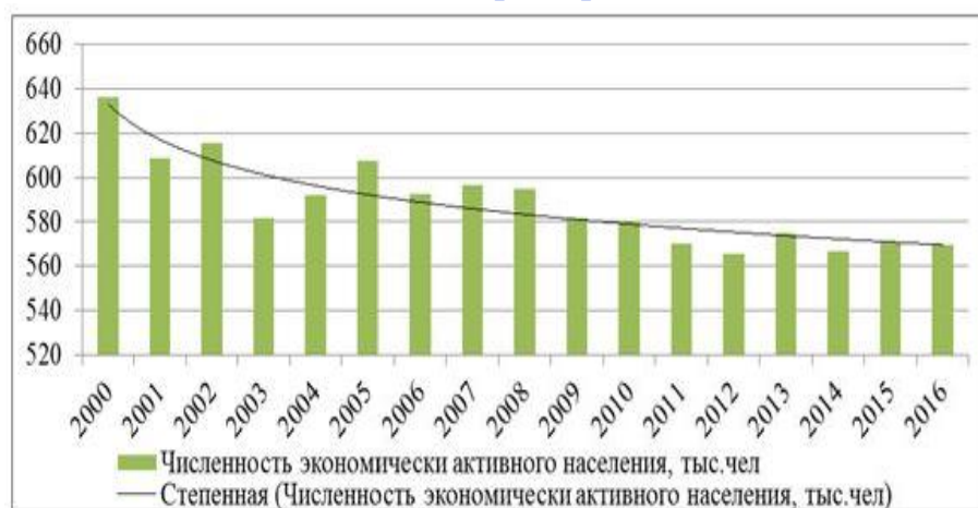
Рис. 2. Динамика численности экономически активного населения в Курской области с 2000г. по 2016г.

!? Какие категории граждан относятся к занятым?