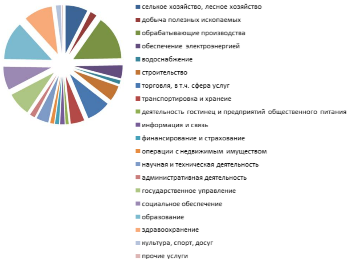
Рис. 3. Среднегодовая численность работников организаций (по данным на 2022 год)

Общая картина занятости представлена на рисунке 3.