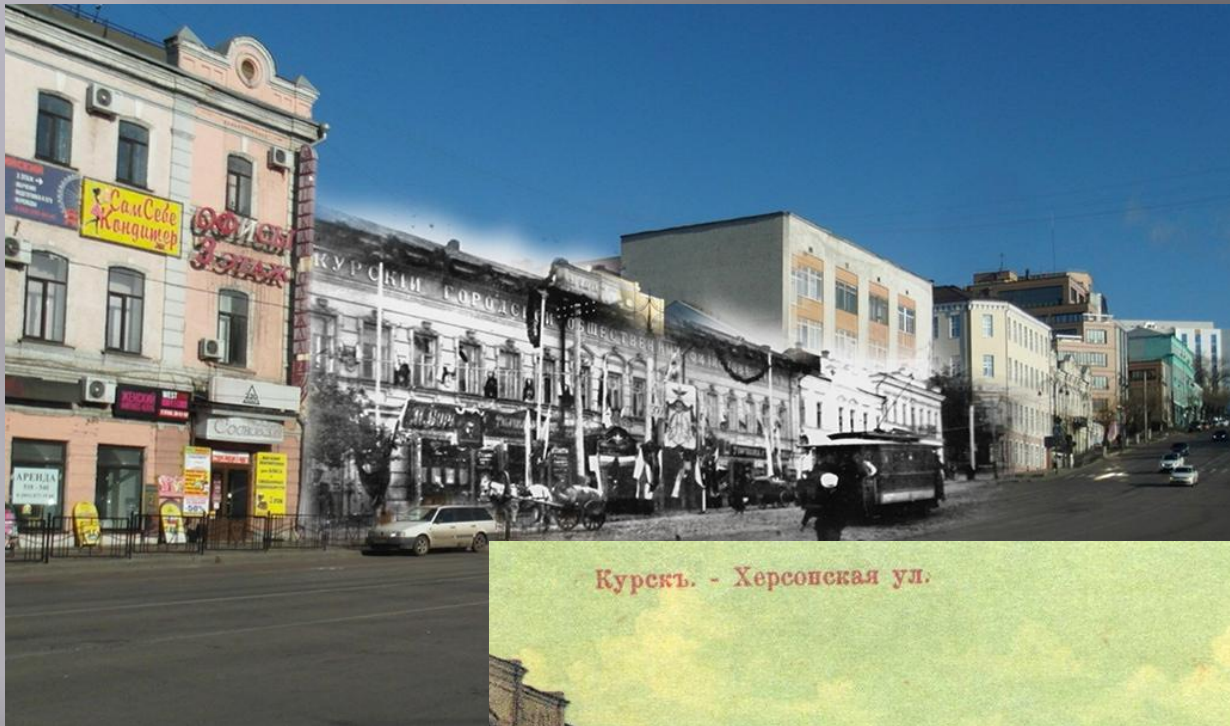
Курскъ. - Херсонская ул.