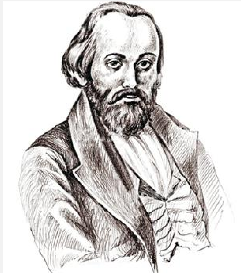
Михаил Васильевич Буташевич-Петрашевский (1821-1866 гг.)

Видное место в истории освободительного движения занимает деятельность кружка петрашевцев. Основателем кружка был молодой и чрезвычайно деятельный чиновник Министерства иностранных дел М.В. Буташевич-Петрашевский. На его квартире с зимы 1845 г. собиралась молодая интеллигенция Петербурга: студенты, учителя, мелкие чиновники, военные.