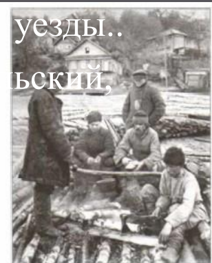
Русские крестьяне-отходники. Начало XX в. Кто такие крестьяне-отходники?