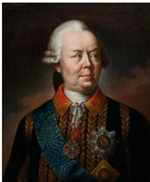
Первый Курский наместник П. А. Румянцев-Задунайский (работы неизвестного художника 1770-х годов) http://100.histrf.ru/commanders/rumyantsev-zadunayskiy-petr-aleksandrovich/