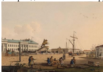
Санкт – Петербург XVIII века